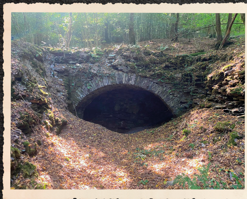
De leisteenmijn van Sauveur