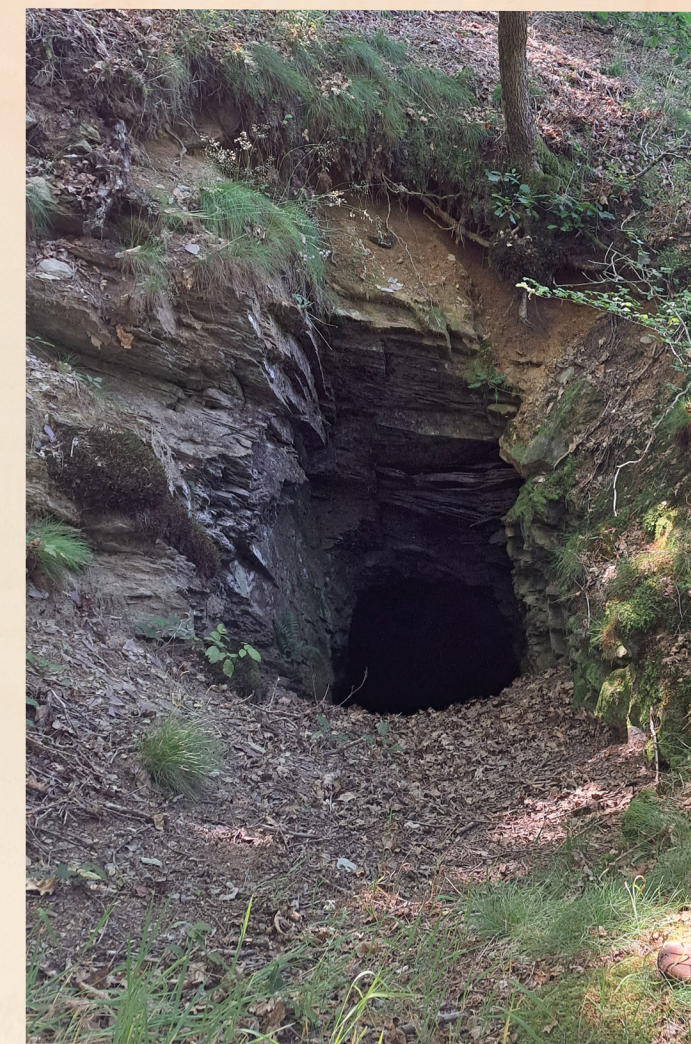
Hoofdingang van de Trou de l'ardoisière