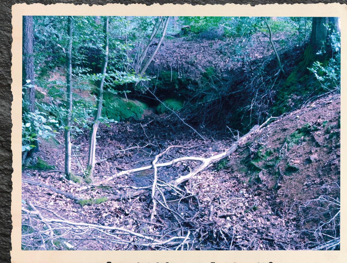
De fontaine Gobin vandaag © Guy Lépine