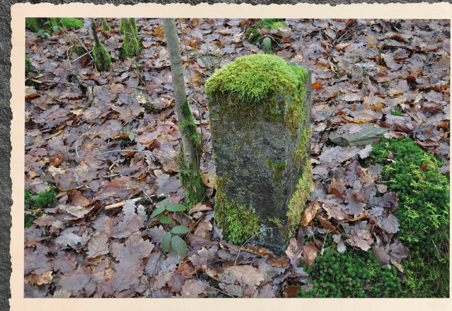
Een van de grensmarkering van de leisteenmijn Fontaine Gobin