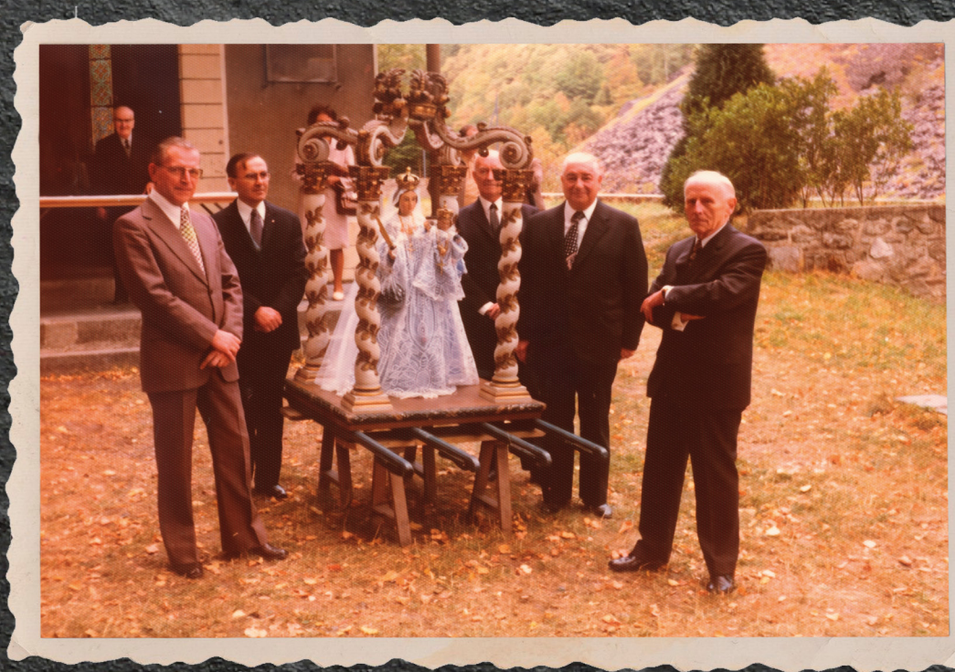
De leden van het broederschap in de jaren 1970