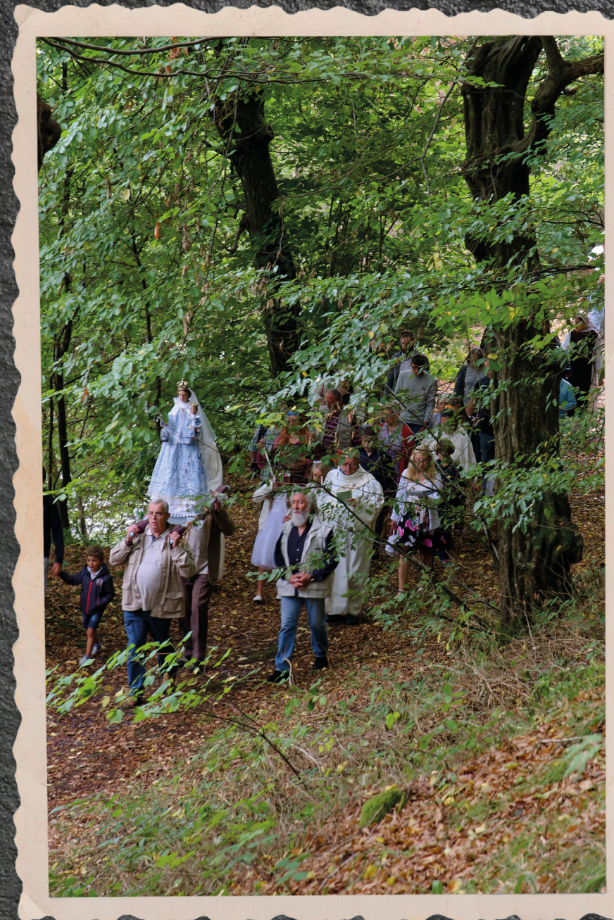
De processie van Notre-Dame in 2017

De kapel, herbouwd in 1802, werd gedeeltelijk verwoest in augustus 1914 tijdens de eerste gevechten van de Eerste Wereldoorlog. De wederopbouw van het gebouw startte in 1919.