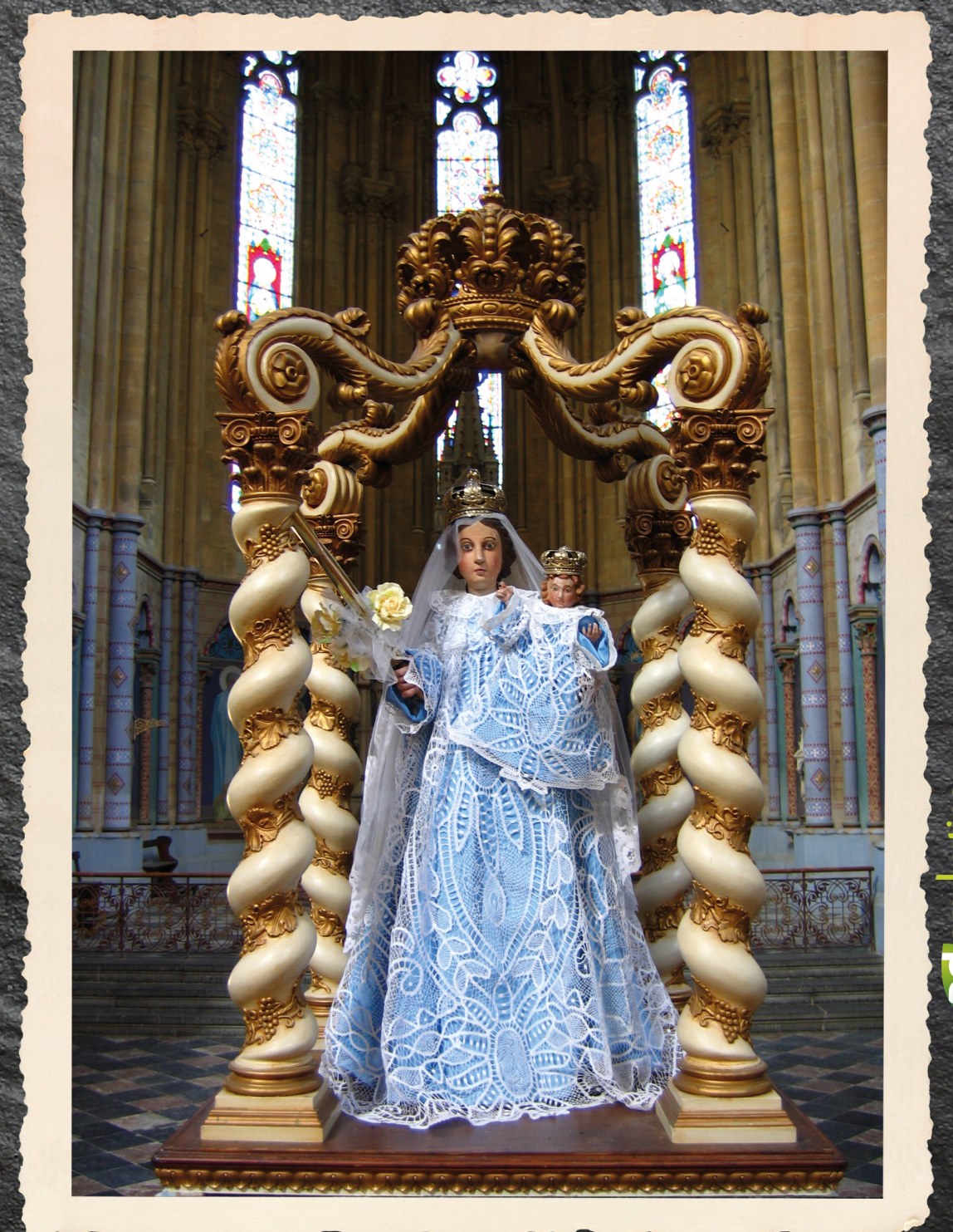
De Maagd 'Notre Dame de Divers Mont' in de kerk in Fumay