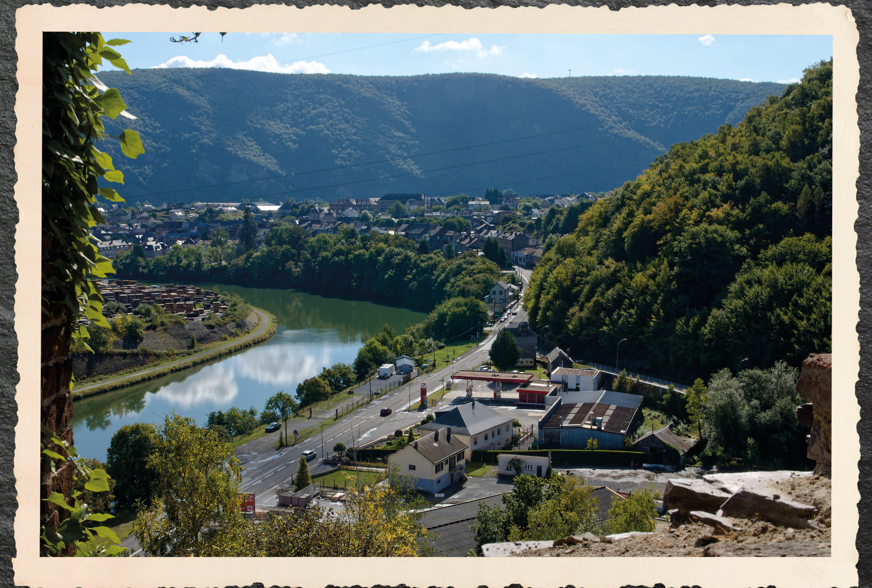
De oude bouwplaatsen gezien vanaf Le Chevalement