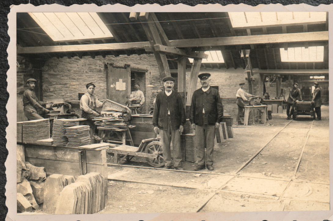
De werkplaatsmanagers poseren voor de foto