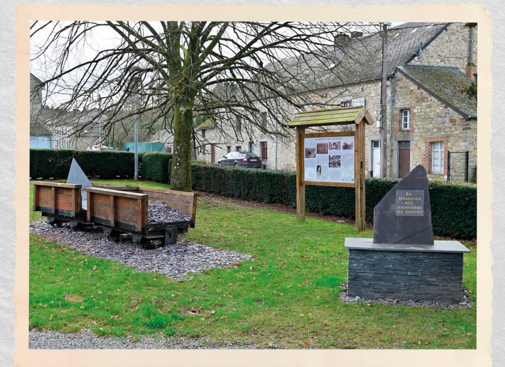
Deze herdenkingsplek werd opgericht als eerbetoon aan de leisteenwerkers van Oignies - 1922 op de Place du Baty

U kan al deze informatie terugvinden op de gemeenschappelijke website: 'Circuit ardoisier transfrontalier - CATAREX' alsook op de Facebook- en Instagram pagina's onder dezelfde naam.